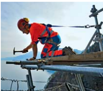
1 Un harnais de retenue bien ajusté ne gêne pas les mouvements lors du travail.