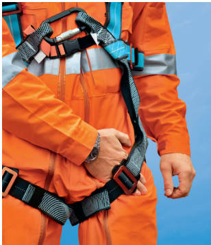
Règle 6 Adapter les équipements.