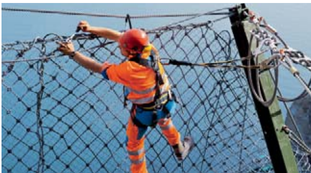
1 En plus de connaissances spécifiques en montage et d'une protection par encordement, ces travaux exigent du calme, de la force et de l'endurance.