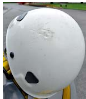
3 Ce casque visiblement endommagé doit aussi être remplacé.