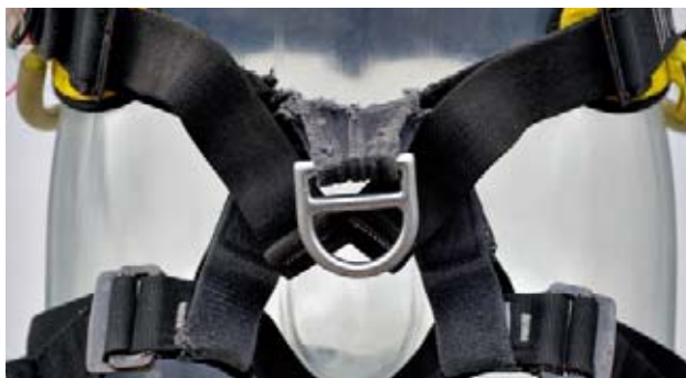
2 Ce harnais fortement endommagé doit être remplacé (de plus ce n'est pas un harnais complet selon EN 361).