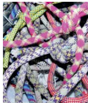
2 La formation permet d'apprendre à reconnaître le matériel à mettre au rebut.