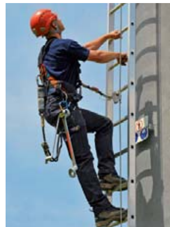
3 Système à glissière de sécurité sur un relais de téléphonie mobile.