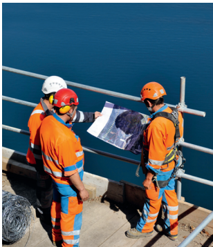
Règle 4 Préparer le travail avec soin.