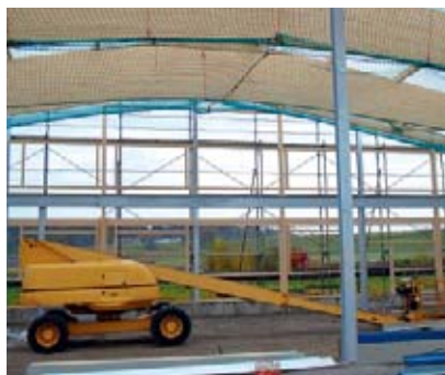
2 Avant de travailler avec une protection par encordement, vérifier l'utilisation des plateformes de travail de levage.