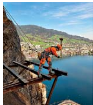
3 Les travaux dans des situations extrêmes exigent une formation et de l'expérience.