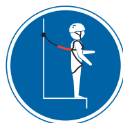
2 Système de retenue: tient l'utilisateur éloigné des zones présentant un risque de chute. Correctement employé, le risque de chute est nul.