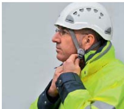
2 Utilisez les possibilités de réglage du casque et de la jugulaire pour un confort optimal.