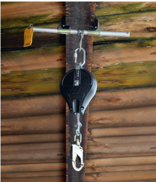
Règle 5 Utiliser des points d'ancrage sûrs.