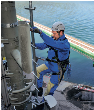
Règle 7 Maîtriser l'utilisation des échelles avec glissière de sécurité.