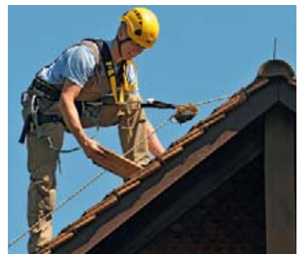
3 Un équipement approprié et bien ajusté permet de travailler confortablement.