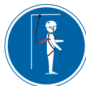
4 Système d'arrêt de chute: correctement employé, il permet de réceptionner l'utilisateur en cas de chute. La force du choc d'arrêt est amortie par un absorbeur d'énergie. Le risque de blessure n'est pas à exclure.