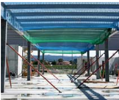
1 en priorité les mesures de protection collective (par ex. des filets).