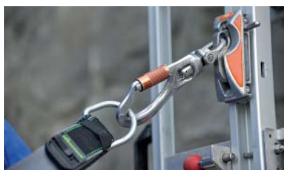
2 Chariot pour glissière de sécurité (rail).