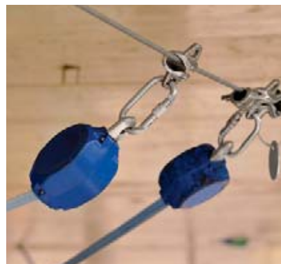
3 Système de cordes fixe selon EN 795 avec possibilité de franchir librement les ancrages intermédiaires.