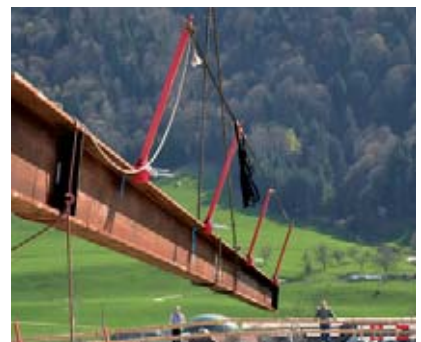
3 Réduire au maximum le temps de travail avec une protection par encordement grâce aux prémontages.