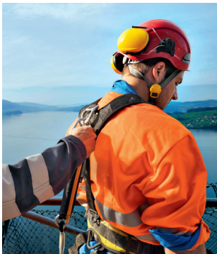
Règle 3 Contrôler les équipements.