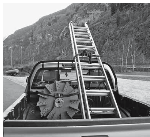
Figure 2: arrimage sur le véhicule.