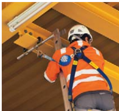
1 Système temporaire servant de point d'ancrage sur les poutres métalliques.