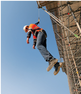
Règle 8 Garantir les secours.