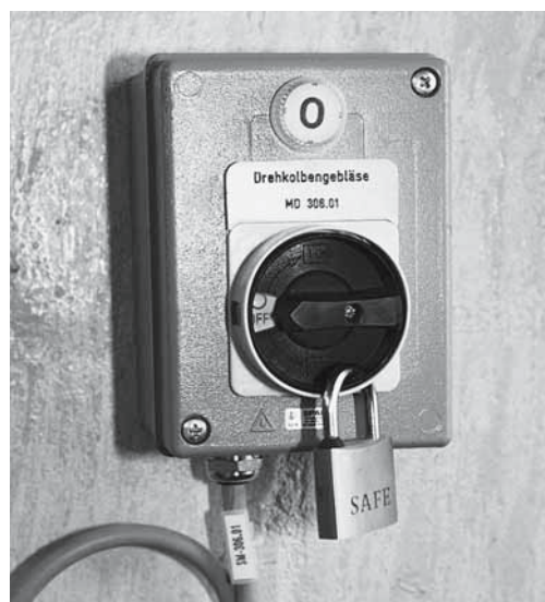
Figure 3: interrupteur de sécurité en position 0, avec cadenas individuel pour prévenir un réenclenchement.