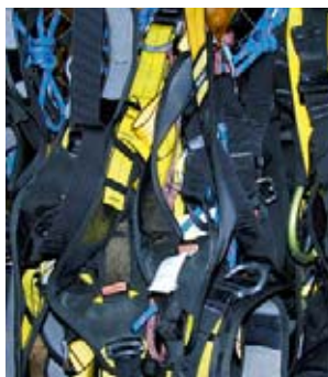
1 Qu'a-t-on contrôlé pour la dernière fois, à quelle date, quand et où l'a-t-on acheté? Il faut pouvoir le justifier.