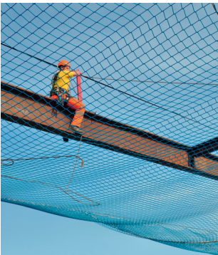
Règle 1 Accorder la priorité aux mesures de protection collective.