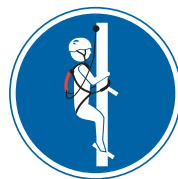
3 Système de positionnement: positionne l'utilisateur sur la zone de travail. Il permet de prévenir une chute libre. Le risque d'accident est très faible.