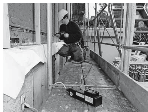
Figure 5: s'il n'y a pas de tableaux de distribution de chantier à disposition, il faut utiliser des prises différentielles mobiles.

Les collaborateurs se renseignent avant le début de leur activité sur les équipements de secours suivants: