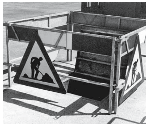
Figure 4: clôture autour de l'ouverture d'une fosse. Les risques découlant de l'exécution de travaux chez le client doivent être limités en collaboration avec le client.