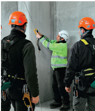
Règle 2 Veiller à la formation.