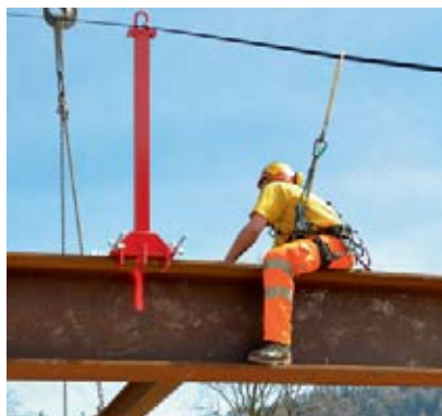
2 Système de montants temporaires pour des ancrages continus.