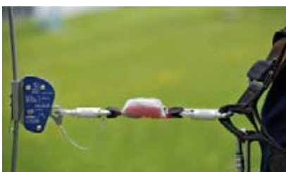
1 Chariot pour câble métallique avec absorbeur d'énergie intégré.